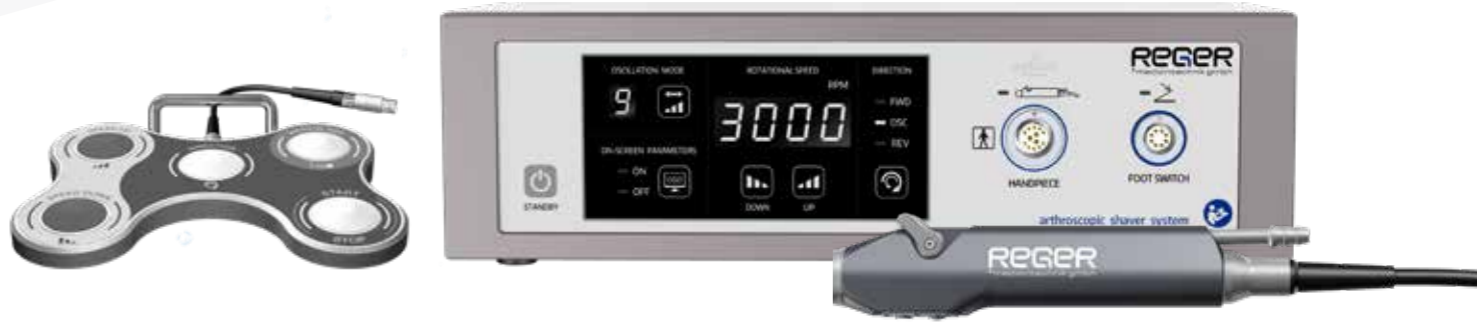
REGER Shaver System, Handpiece and Foot Switch

Burs compatible with common manufacturers' systems!